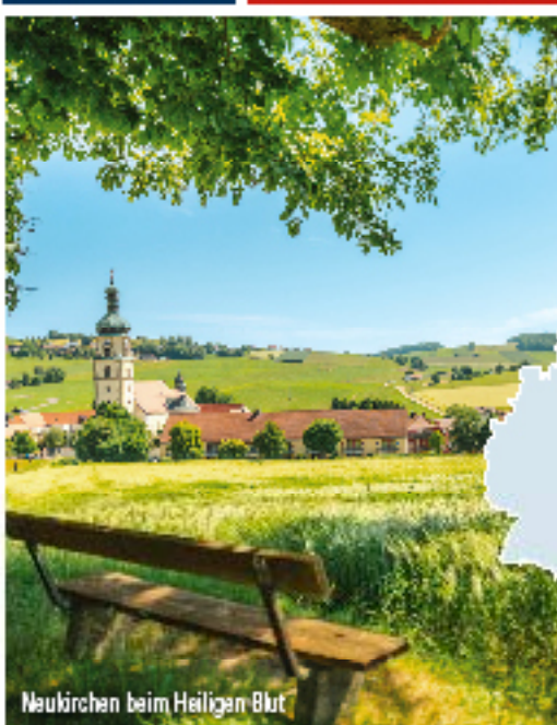
Neukirchen beim Heiligen Blut